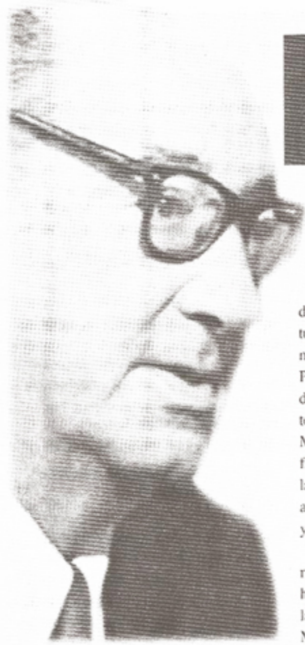
Lo recuerdan en el centenario de su nacimiento.

La iniciativa cultural "Boliches en Agosto", que se realiza anualmente, rendirá tributo al escritor uruguayo Juan Carlos Onetti, en el centenario de su nacimiento.